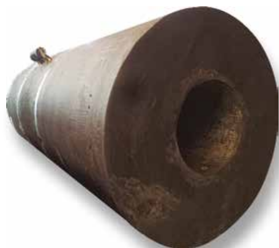
Camisa bruta com corpo de prova em apenso.