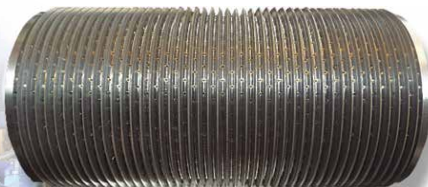
Camisa de moenda pronta.