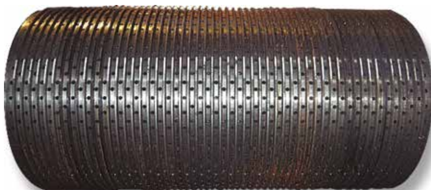
Camisa com furação para montagem de boquilhas.