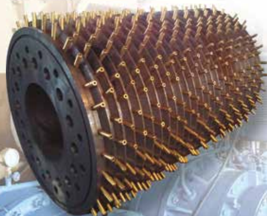
Camisa em processo de montagem de boquilhas.